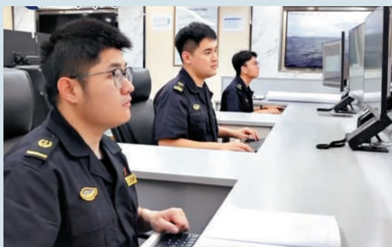
▲大陸方面巡航期間，首次對台灣島東部海域進行掃測，補齊台灣島東部海底地圖。

此外，民進黨當局聲稱6月5日一艘大陸海警船進入東沙群島的「限制水域」，雙方船隻發生對峙。張哈指出，中國對南海諸島包括東沙群島及其附近海域擁有主權。大陸海警部門在相關海域執法巡查，是正常履職行為。民進黨當局膽敢挑釁，必須承擔由此引發的一切後果。