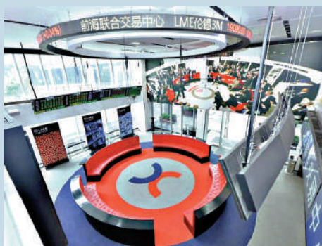
▲深港交易所合作已從單一業務對接升級為全生態協同共建。圖為前海聯合交易中心。