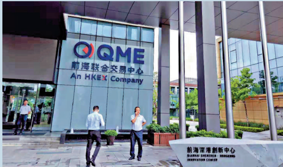
▲當前，粵港澳大灣區資本市場集聚效應持續凸顯，累計256家灣區企業在港上市，總市值達11.22萬億港元。圖為港交所在前海成立的前海聯合交易中心。