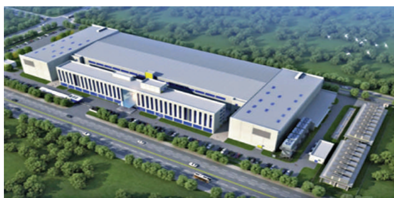
北京壹號詞元工廠是面向智能體時代的「新型電廠」，實現像用電力一樣用Token。