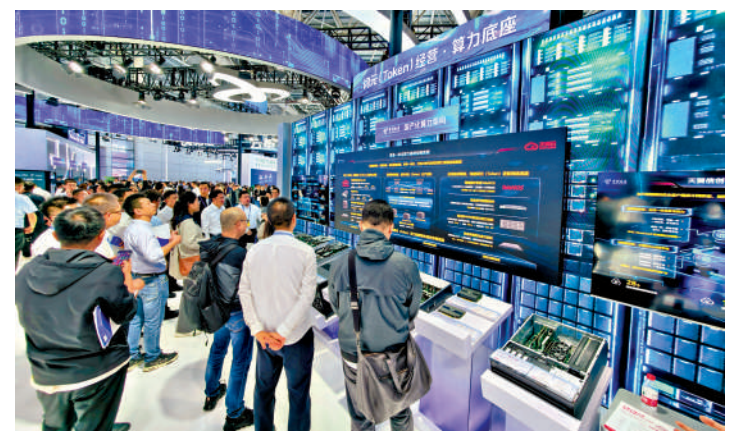
4月29日，遊客在第九屆數字中國建設峰會參觀國產算力底座。