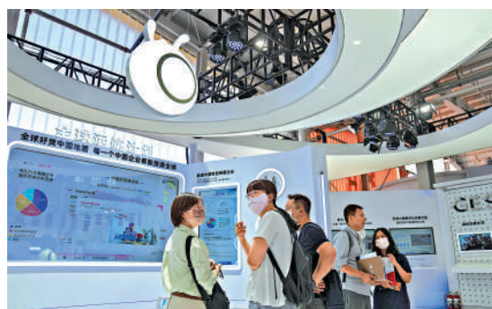
▲螞蟻曾於2020年計劃以「A+H」形式上市，但在上市前夕被叫停。

去年中，市場消息傳出，螞蟻集團計劃將旗下新加坡註冊的螞蟻國際單獨在香港上市，並與相關監管部門溝通上市的可能性。