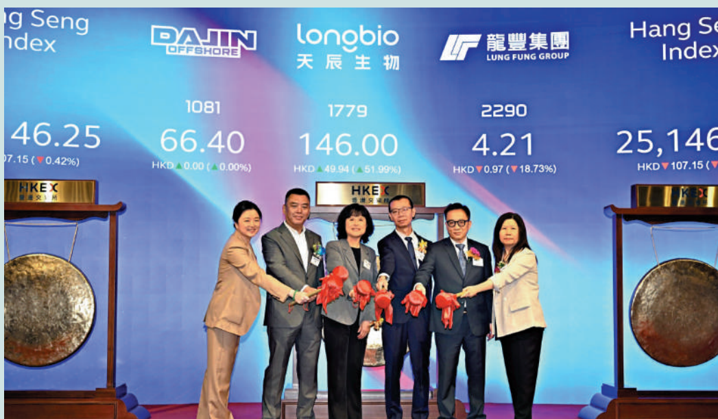
▲現時有超過400家企業排隊在港上市。圖為天辰生物、大金重工與龍豐集團三隻新股於上周五同日掛牌。