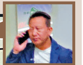
獲准保釋後離開法院。 大公報記者麥潤田攝

警方與廉政公署昨日 落案起訴與宏福苑大火相關 的7名人士及2間公司。圖 為昨日接載被告的囚車。 大公報記者麥潤田攝