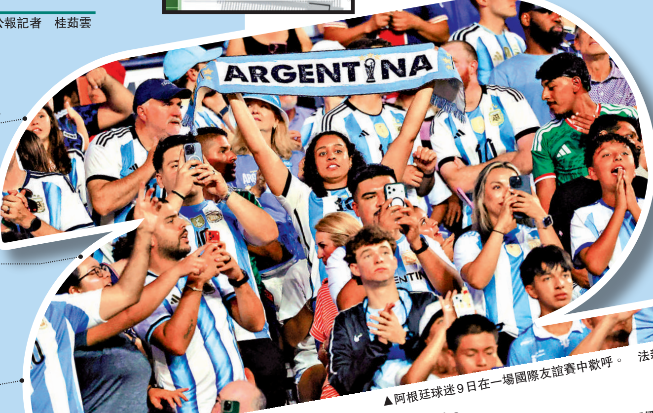
▲阿根廷球迷9日在一場國際友誼賽中歡呼。