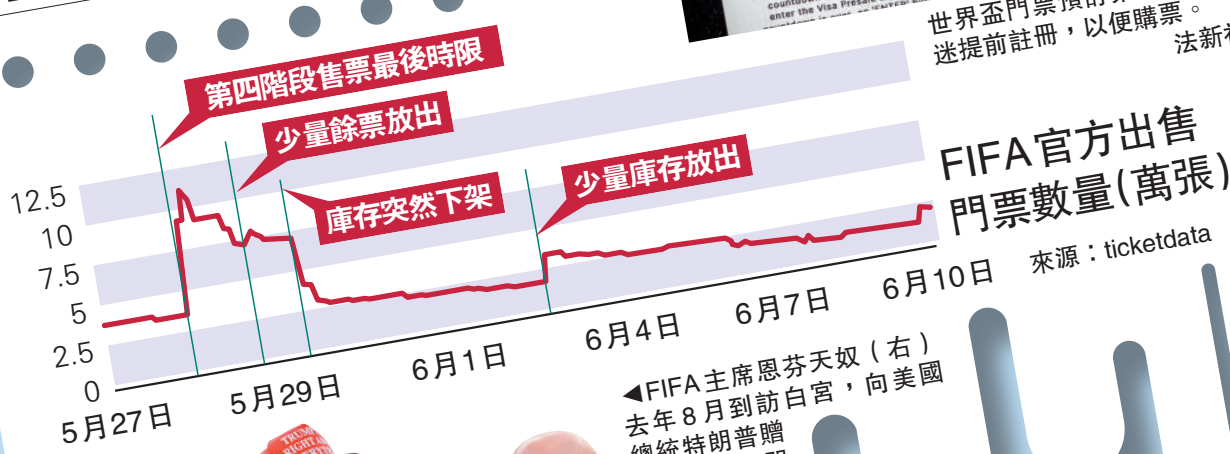
FIFA官方出售門票數量(萬張)

◀FIFA主席恩芬天奴(右)去年8月到訪白宮，向美國總統特朗普贈送世界盃門票。