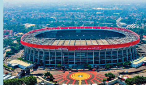
▲比利（圖上右）與馬拉當拿（圖上左）皆在阿茲特克體育場贏得世盃冠軍寶座。