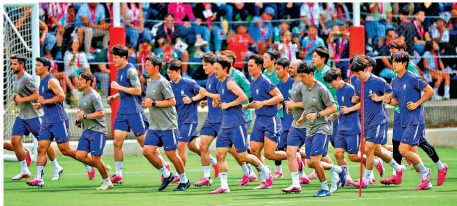
▲韓國隊球員賽前積極操練。