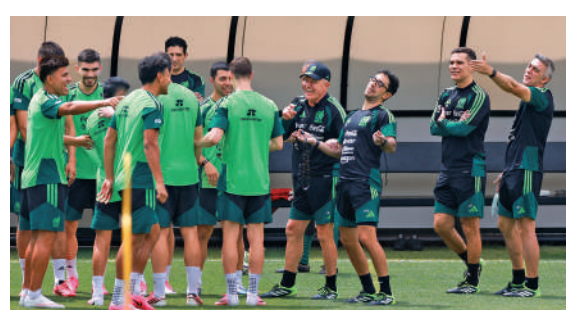
▲墨西哥隊職球員以輕鬆心情迎接揭幕戰。