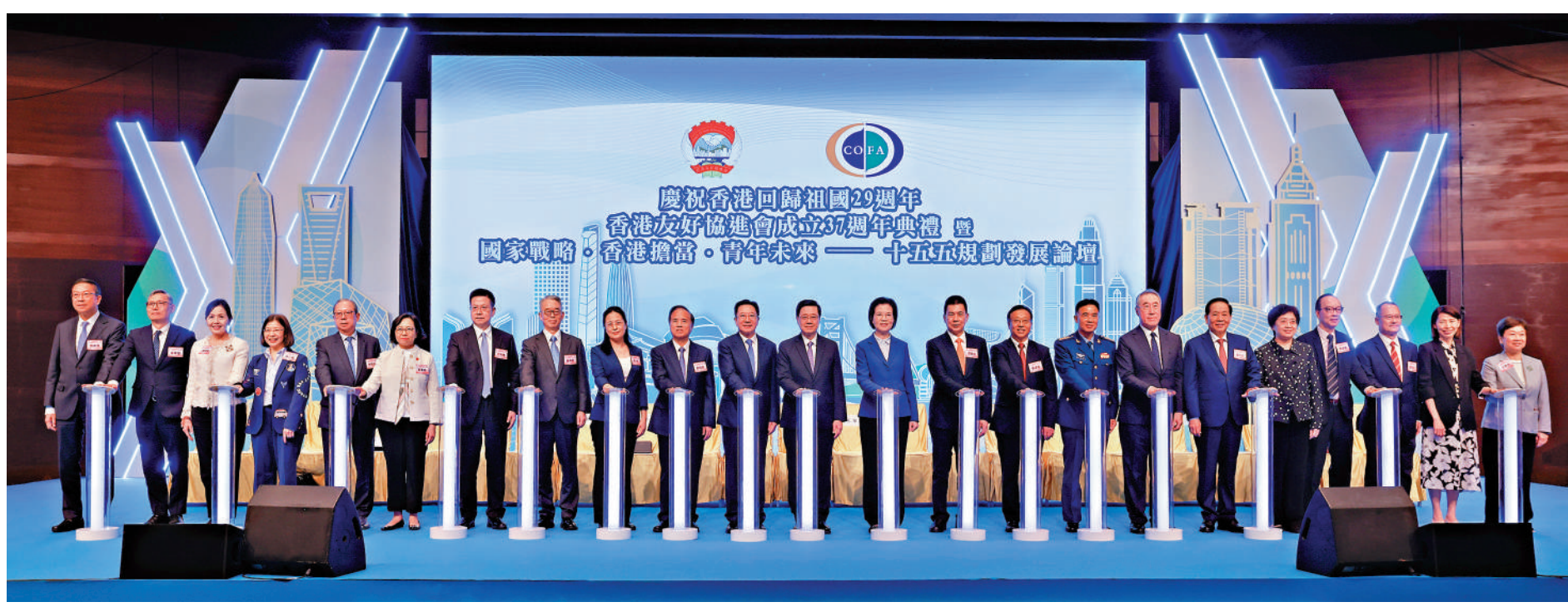
▲「慶祝香港回歸祖國29周年、香港友好協進會成立37周年典禮暨國家戰略·香港擔當·青年未來——『十五五』規劃發展論壇」昨日舉行，主禮嘉賓在台上合照。

李家超表示，今年是國家「十五五」規劃開局之年，他正帶領特區政府全力編制香港首個五年規劃，制定具有戰略性、系統性的宏觀藍圖，為香港未來發展拓展新方向、開創新空間、注入新動能，公眾諮詢將於下周一展開。周霽表示，期待香港各界以主人翁姿態建言、謀良策、出實招，全力支持特區政府編制好首個五年規劃，推動由治及興、引領未來發展。