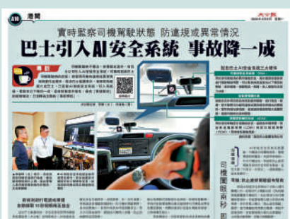
先報導有旅巴公司引入司機狀態監察系統。

城巴回應《大公報》查詢表示，數年前已自行研發並於全線車隊應用「智駕全城」安全駕駛系統，為行車期間向車長提供實時駕駛提示，確保巴士行駛平穩，減少急刺或急轉彎的情況；車長亦可透過系統重溫及檢討自身的駕駛表現，提升駕駛水平。現時城巴有逾1200輛巴士已配備電子穩定控制系統，數量佔整體車隊逾七成半。此外，城巴機場快線及北大嶼山路線的全線車隊更已配備駕駛安全輔助系統，為乘客及道路使用者提供更全面的安全保障。城巴未來將繼續與業界保持緊密交流，持續試驗及引入更多結合先進技術的安全駕駛系統。