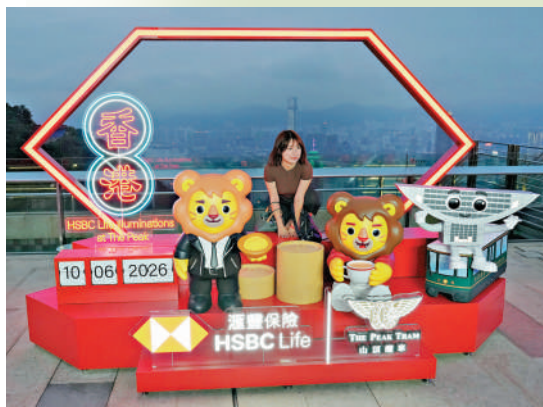
▲山頂設置全新打卡裝置，吸引旅客。