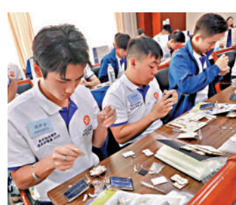
▲保安局青年領袖親手組裝衛星模型。

展專家講座，深入了解中國航天歷史及其間艱辛的發展歷程。學員深刻體會到，昔日一片荒漠的「航天城」，如何經由多位位心投入國家航天事業的前輩專家，一步步打造成今日國際級規模的重要基地。