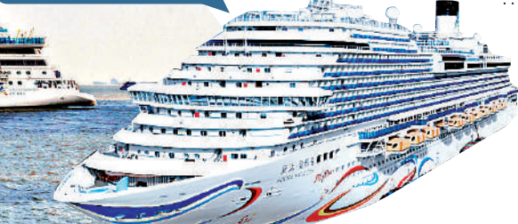
▲兩艘國產郵輪將於今年訪港。