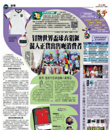
▲《大公報》近日揭發本地冒牌及高仿球衣氾濫的問題。

海關指出，檢獲的冒牌球衣主要屬於售價較高的「球員版」，並涉及熱門球隊，售價約為1100至1300元，相信不法分子企圖藉世界盃盛事促銷，並提高「球員版」假貨比例以增加利潤，今次檢獲的冒牌球衣，均為轉口運往外地，當中近八成運往美洲地區。