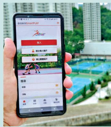
▲市民在7月7日起，透過「智方便」登入「SmartPLAY康體通」的用戶，可優先15分鐘預訂設施。