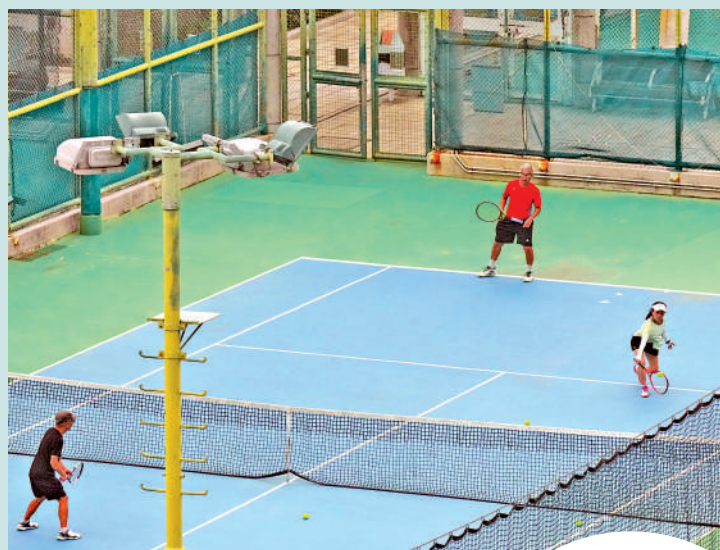
▲康文署昨日宣布推出加強核實身份措施，進一步打擊「炒場」行為。