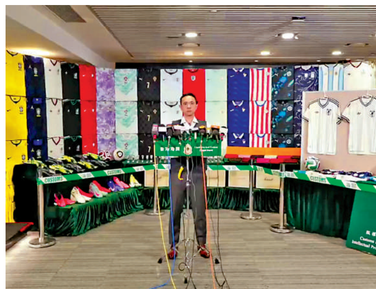
如冒牌球衣的隊徽較為粗糙，以光照射即可明顯看出差異，正牌球衣圖案較為立體且富有層次感，觸感亦有分別。

海關表示，部分冒牌球衣仿真度甚高，刻意仿製正牌球衣布料的立體紋路，甚至附有相關品牌吊牌，採獨立包裝，並在隊徽或品牌標籤等容易刮損的位置以透明貼紙或透明紙包裹保護，企圖令冒牌貨更貼近正貨包裝以欺騙消費者。不過，買家只要仔細觀察，仍然可以分辨真假，例