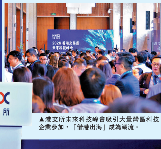
▲ 港交所未來科技峰會吸引大量灣區科技企業參加，「借港出海」成為潮流。