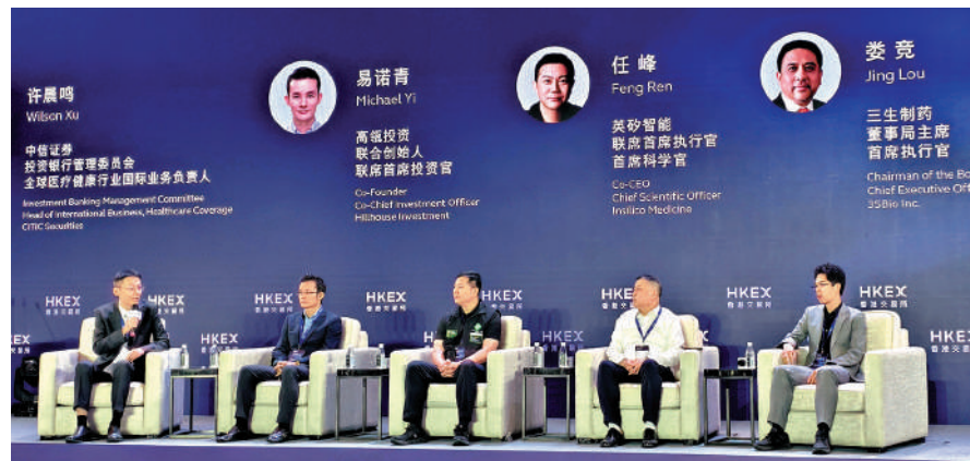
▲ 嘉賓在港交所未來科技峰會的論壇環節上，暢所欲言。

他說，中國生物科技企業全球化是必然的道路，但生物科學和生物醫藥行業，在很多國家都受到高度監管，所以要與海外巨頭進行BD交易，讓他們幫助中國的項目「走出去」。