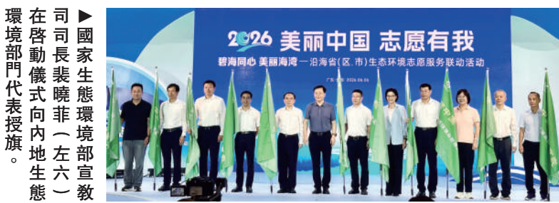
▲國家生態環境部副部長裴曉菲(左六)在啟動儀式向內地生態環境部門代表授旗。

黃坤明在致辭中表示，廣東扎實推進綠美廣東生態建設，開展全域生態系統治理，抓好山海林生態修復、夯實生態基底，持續攻克突出環境問題，推動生態產業雙向轉化，探索生態價值實現新路徑。以本次活動為契機，廣東將堅持生態優先、綠色發展，全力打造人與自然和諧共生的美麗廣東樣板。