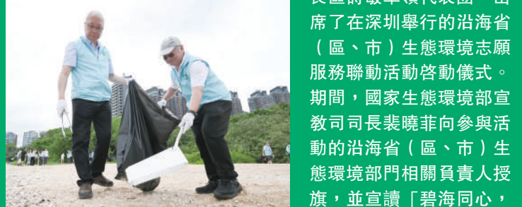
▲環境及生態局局長謝展寰(左)及環保署署長徐浩光(右)參與活動。

同日，環境及生態局副秘書長(環境)譚卓姿和環保署副署長區詩敏率領代表團，出席了在深圳舉行的沿海省(區、市)生態環境志願服務聯動活動啟動儀式。