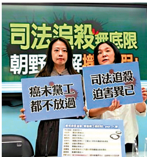
▲島內在野黨議員舉行記者會，批評民進黨當局利用司法製造「綠色恐怖」。

國台辦發言人張晗10日在新聞發布會上表示，民進黨當局操弄司法手段打擊迫害政治異己，大搞「綠色恐怖」，引發島內民眾強烈不滿。