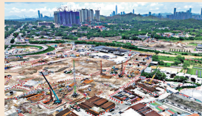
▲李家超強調北都發展並非單純增加土地及房屋供應。圖為古洞新發展區。

李家超總結四年施政經驗，認為規劃至關重要。以往有各種藍圖（青年、創科、交通、土地等），但時間節點不一，配合未盡完善。現在以五年規劃為共同時間表，大家步伐一致，便能相輔相成。