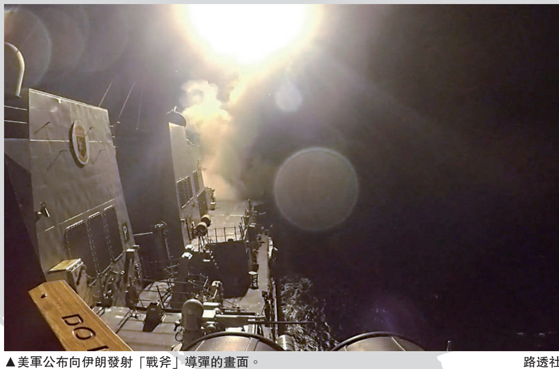
▲美軍公布向伊朗發射「戰斧」導彈的畫面。