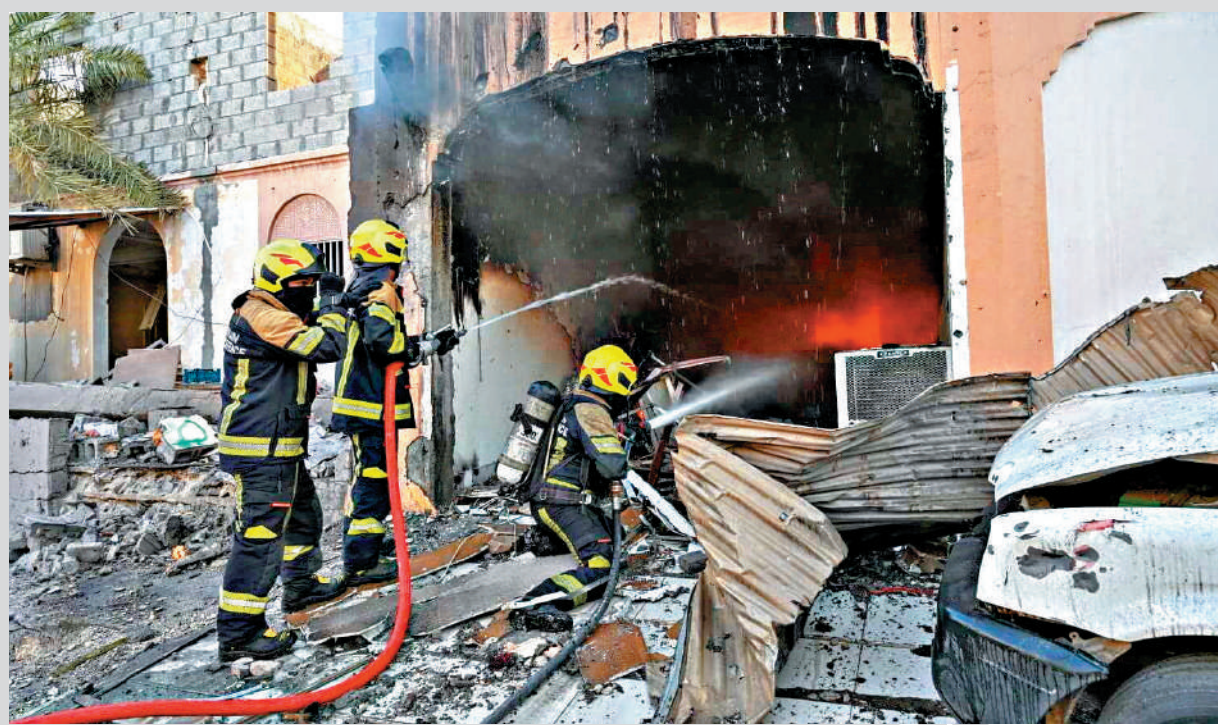
▲巴林11日遭伊朗無人機襲擊。