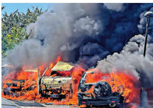
▲以色列10日再度空襲黎巴嫩。