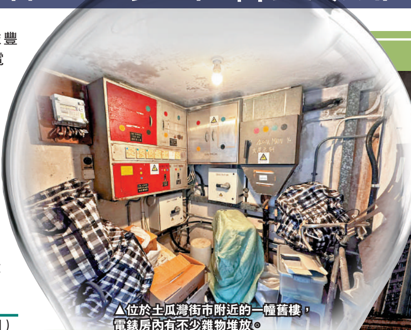
位於土瓜灣街市附近的一幢舊樓，電錶房內有不少雜物堆放。