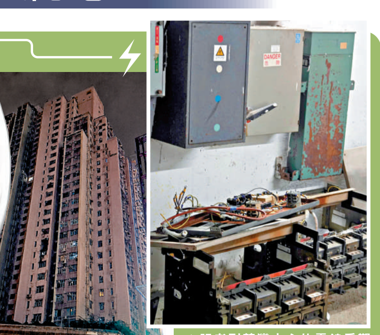
記者到荃灣中心的電錶房觀察，有工人將損毀的電錶零件拆下。