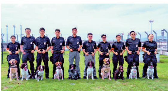
▲行動小組可在戶外訓練場訓練機場保安犬隻。

【大公報訊】記者喻靜怡報導：昨日（12日），機場保安有限公司於機場第二客運大樓舉行盛大典禮，慶祝機場保安犬隻行動小組正式邁進成立五周年的新里程。機管局行政總裁張李佳蕙介紹，小組在短短5年間發展迅速，犬隻數目已由最初僅有的2隻，大幅擴展至現時的20隻。這支隊伍目前以「一人一狗」的緊密合作模式駐守香港國際機場，肩負起搜查爆炸品、槍械、彈藥，以及處理無人看管行李的重任。