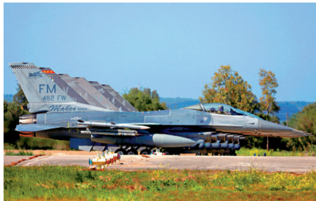
▲美軍F-16戰機部署在希臘一個空軍基地。

【大公報訊】據《紐約時報》報道：兩名歐洲高級官員12日披露，美國計劃大幅削減部署在歐洲北約盟友的戰機和軍艦數量。美軍歐洲司令部本月初曾表示，美方已通知盟友，將「調整美方對北約部隊的貢獻」。