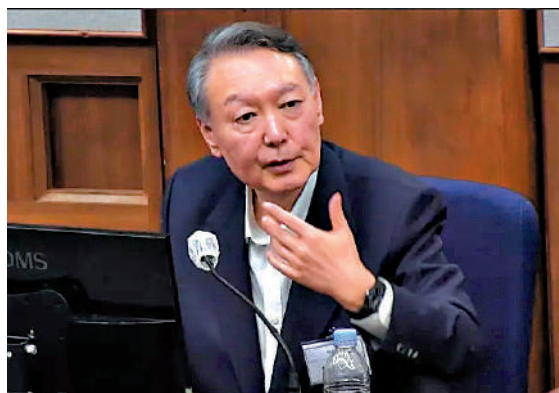
▲尹錫悅面臨多宗刑事訴訟。

2024年12月3日晚，韓國時任總統尹錫悅以「從北勢力」為由發布緊急戒嚴令。次日凌晨，韓國國會通過要求解除戒嚴令的決議案。此後，尹錫悅先後被停職、逮捕、彈劾。尹錫悅目前身陷多宗刑事訴訟。今年2月，首爾中央地方法院以內亂頭目罪名，一審判處尹錫悅無期徒刑。