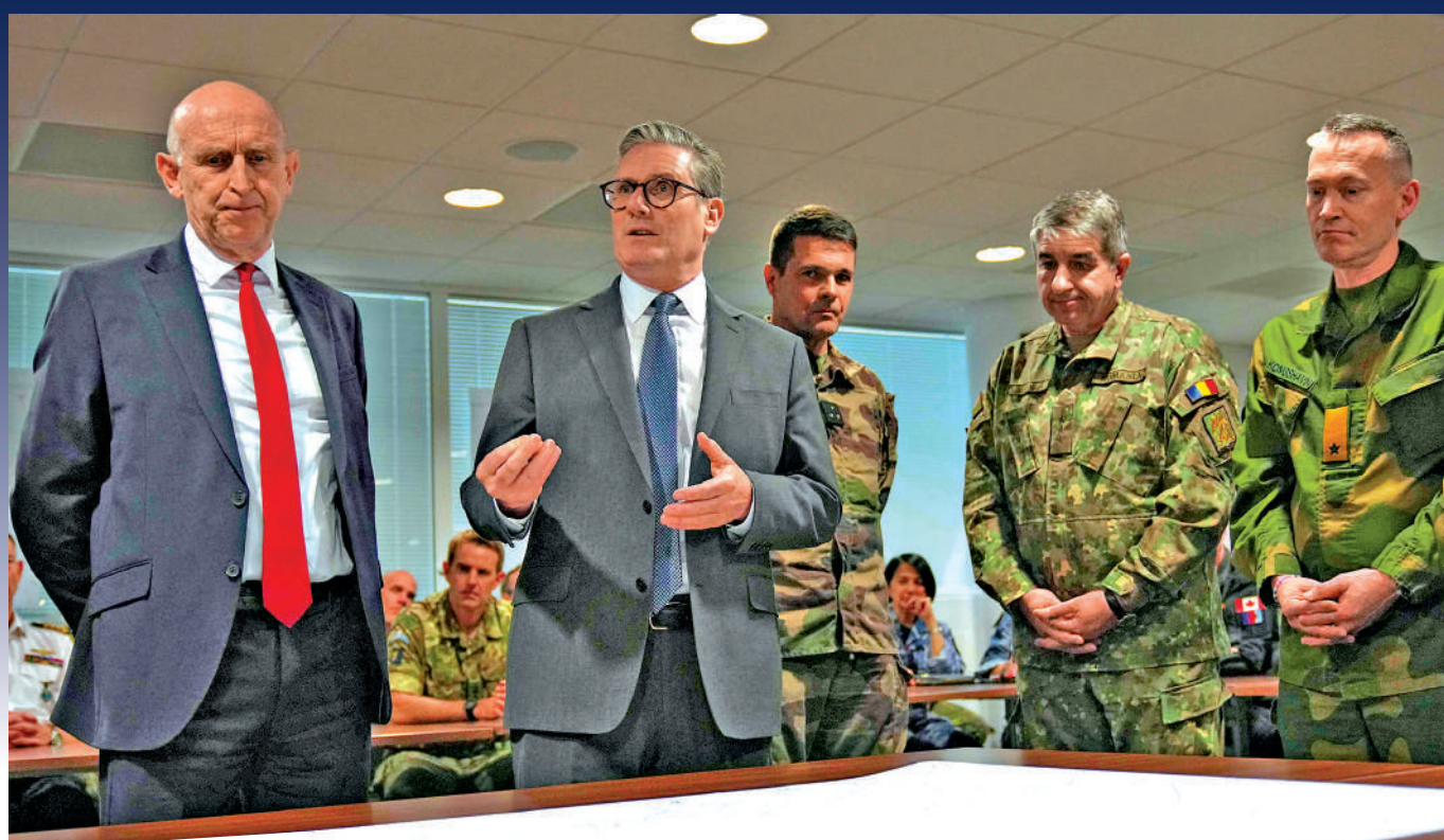
▲希利（左一）辭去英國國防大臣職務，斯塔默（左二）再陷政治危機。

當地時間11日，英國國防大臣希利因不滿斯塔默政府的國防投資計劃資金方案突然辭職，英國負責武裝部隊事務的國務大臣卡恩斯當天也宣布辭職。卡恩斯致函英國首相斯塔默，批評當前政府擬定的國防投資計劃「既缺乏變革性，也缺乏足夠資金支持」。雖然斯塔默火速任命賈維斯為新任國防大臣，但風波並未平息。斯塔默近期本就面臨工黨內部「逼宮」，首相之位不穩，希利和卡恩斯辭職讓他更加被動。