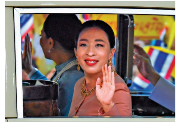
▲泰國公主帕查拉吉迪雅帕2020年在曼谷向民眾揮手。資料圖片

在瑪哈·哇集拉隆功的子女中，僅有三名子女擁有正式頭銜繼承權，帕查拉吉迪雅帕是其中之一。如今帕查拉吉迪雅帕逝世，泰國王位繼承再添變數。