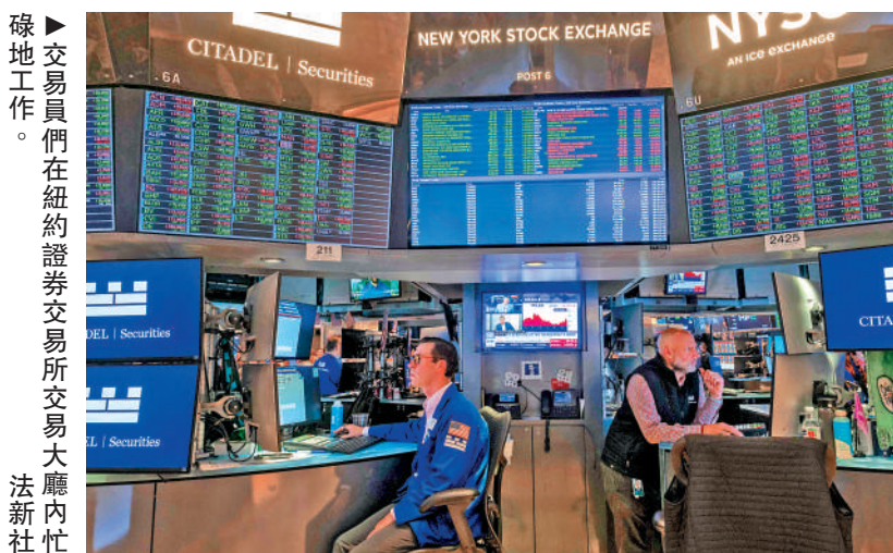
▲交易員們在紐約證券交易所交易大廳內忙碌工作。