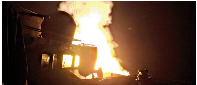
▲美軍從「墨菲號」驅逐艦上向伊朗發射「戰斧」導彈。

伊朗媒體披露的上述草案目前尚未得到伊朗官方確認。分析認為，伊媒12日披露的美伊14點諒解備忘錄草案，相較5月伊方提出的14點談判方案，在主權紅線、核心訴求上完全沒有妥協，同時進一步細化條款細節、增加時間限制等。