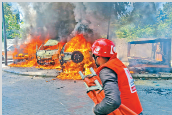
▲伊朗要求包括黎巴嫩在內的所有中東戰線停火。圖為以色列襲擊黎巴嫩南部城市西頓，多輛車起火。