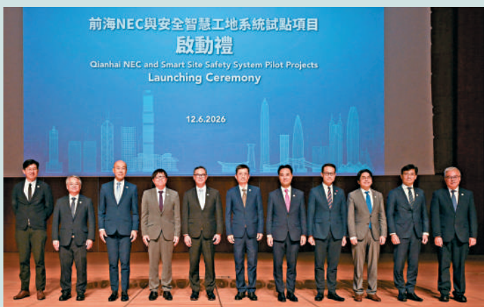
▲發展局與廣東省住房和城鄉建設廳及深圳市前海深港現代服務業合作區管理局昨日宣布，在前海推出五個試點項目，採用香港「新工程合約」模式或「安全智慧工地」系統。圖為一眾嘉賓合照。