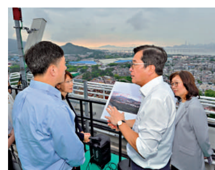
▲黃偉綸（左二）與陶永欣（左一）及兩地代表團，圍了了解該新發展區的規劃布局。

出席會議的特區政府官員包括發展局局長常漢豪、保安局局長鄧炳強、運輸及物流局局長陳美寶，以及其他相關部門首長。