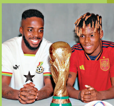
▲世界盃前，有媒體邀請威廉斯兄弟以世界盃主作合照。