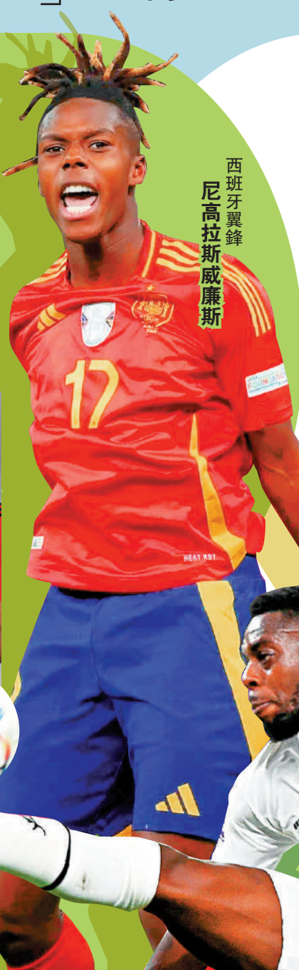
西班牙翼鋒 尼高拉斯威廉斯