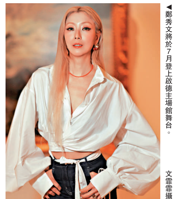
▲鄭秀文將於7月登上啟德主場館舞台。