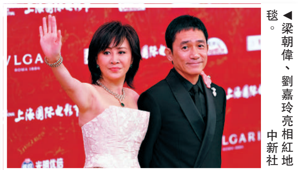
▲梁朝偉、劉嘉玲亮相紅毯。