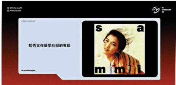
▲鄭秀文的首張粵語專輯《Sammi》。