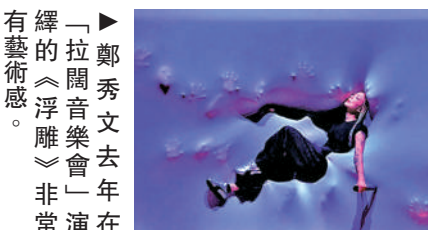
▲拉開音樂會「浮塵」非常演在