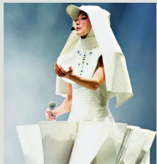
▲鄭秀文在台上常常嘗試不同風格演出。

Sammi指現在的觀眾鑒賞能力高了，加上在網上可以看到很多新資訊，接受能力更高。未來，她都會做更多藝術成分更高的作品。Sammi不諱言多年來都是不斷追求新鮮感，沒有固定的規律，想變時就變，不論是音樂、表演形式、形象、外形也是一樣。以前由「肥嘟嘟」減肥到「鋼條形」，也是蛻變的過程，而現在的她則追求健康的身形。