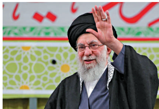
▲2月1日，時任伊朗最高領袖哈梅內伊在德黑蘭向人群揮手致意。

巴基斯坦總理夏巴茲13日表示，美伊之間的和平協議可能在未來24小時內最終敲定。伊朗外交部當天稱，不排除未來幾天內簽署伊美諒解備忘錄。伊朗媒體同日披露哈梅內伊的葬禮時間安排，據信是等待相對和平的時間點，再舉行這一重要儀式。