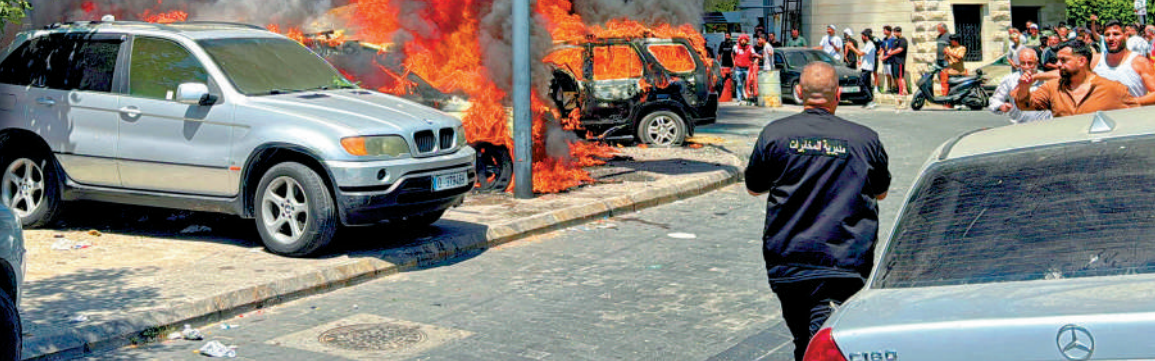
▲阿拉格齊稱，伊朗僅接受在境內稀釋處理濃縮鈾庫存。圖為位於伊朗伊斯法罕省的納坦茲核設施。