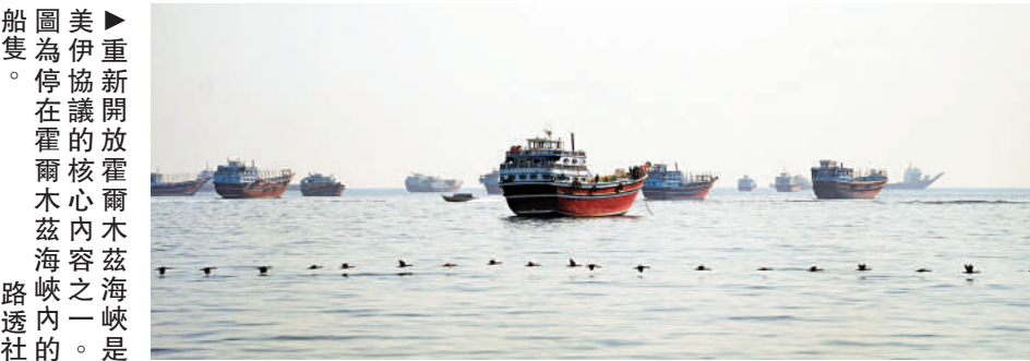
▲美伊重新開放霍爾木茲海峽之爭。圖為在霍爾木茲海峽內的一艘油輪。

另據美媒報道，美軍中央司令部12日稱，美軍過去幾小時內擊落多架飛往霍爾木茲海峽的伊朗單向攻擊無人機。