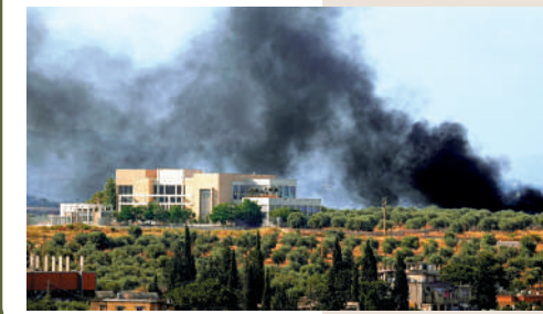
▲以色列13日繼續空襲黎巴嫩南部地區。