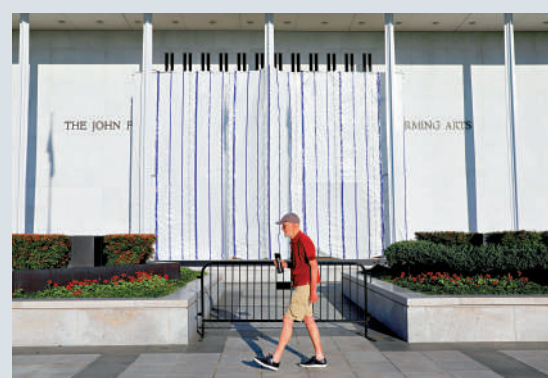
▲特朗普姓名被移除後，肯尼迪中心的外牆部分區域仍被帆布覆蓋。

特朗普去年1月重返白宮後不久就撤換了肯尼迪中心原有管理層，並親自挑選成員組成新的董事會。新董事會去年12月投票決定把肯尼迪中心更名為「特朗普-肯尼迪中心」。中心董事