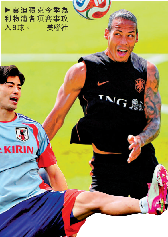
▶ 雲迪積克今季為利物浦各項賽事攻入8球。