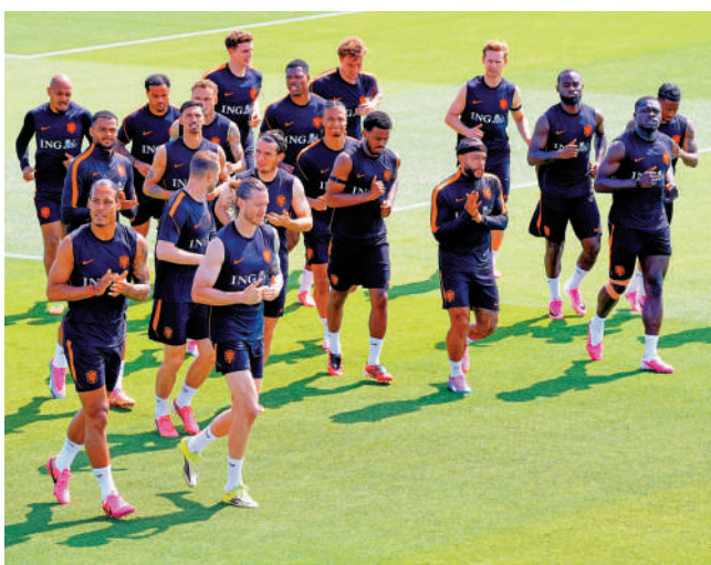
▶ 荷蘭隊球員訓練中緩步跑。