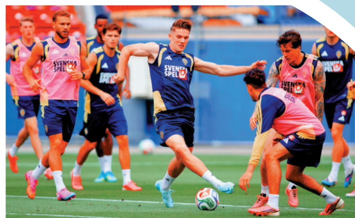
▶ 瑞典前鋒基奧基斯(右四)踢法簡單直接。

預計雙方會形成瑞典以高質前鋒進攻、突尼斯嚴密防守並爭取反擊的格局，且看是瑞典破缺口還是由突尼斯反擊取勝。