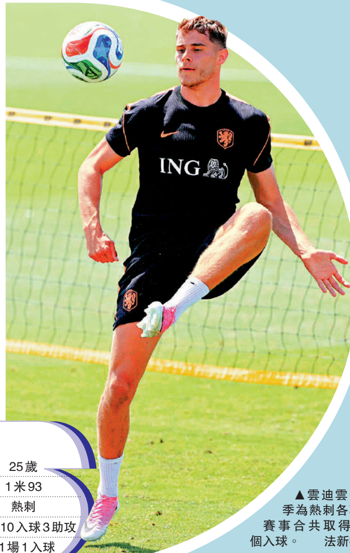
▶ 雲迪雲今季為熱刺各項賽事合共取得7個入球。