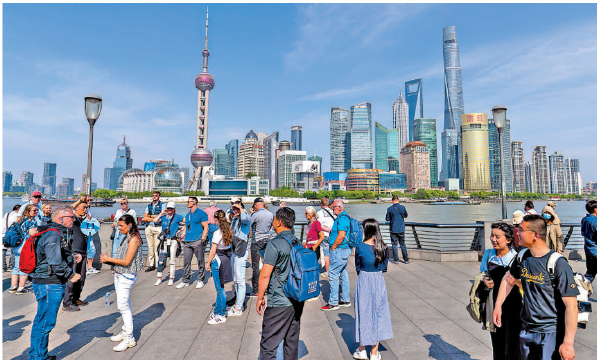
▲全球經濟再平衡之下，具有競爭優勢經濟體將吸引更多國際資本，「投資中國」成為新趨勢。