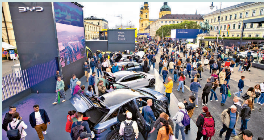
▲比亞迪等中企積極拓展海外市場，中企正掀起新一輪全球化浪潮。