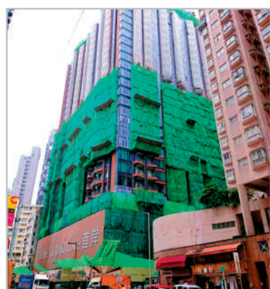
▲首岸系列累售640伙，佔可供發售單位約95%，套現約54.5億元。

【大公報訊】儘管過去周末天氣不穩，但新盤銷情未受影響，恒地（00012）夥希慎興業（00014）及帝國集團發展，位於紅磡的重建項目首岸第4期，昨日進行首輪銷售，全日共沽59伙，並錄得8組大手客掃貨，發展商即日加推50伙，落實本周四進行次輪銷售。