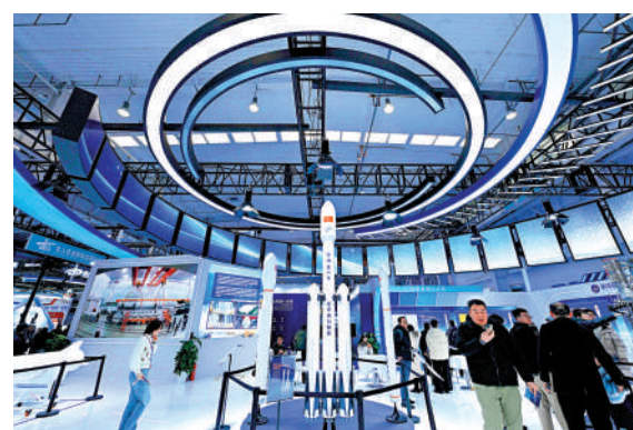
▲中國商業航天產值預計到2030年將增至10.9萬億元。

分析認為，AI發展帶動對算力的需求不斷增長，而太空計算有望與地面數據中心形成互補，令衛星應用逐漸向計算基礎設施演進，其中星基計算解決方案正成為重要的發展方向，加上發射成本進一步下降，料將成為未來數字基礎設施的重要組成部分。