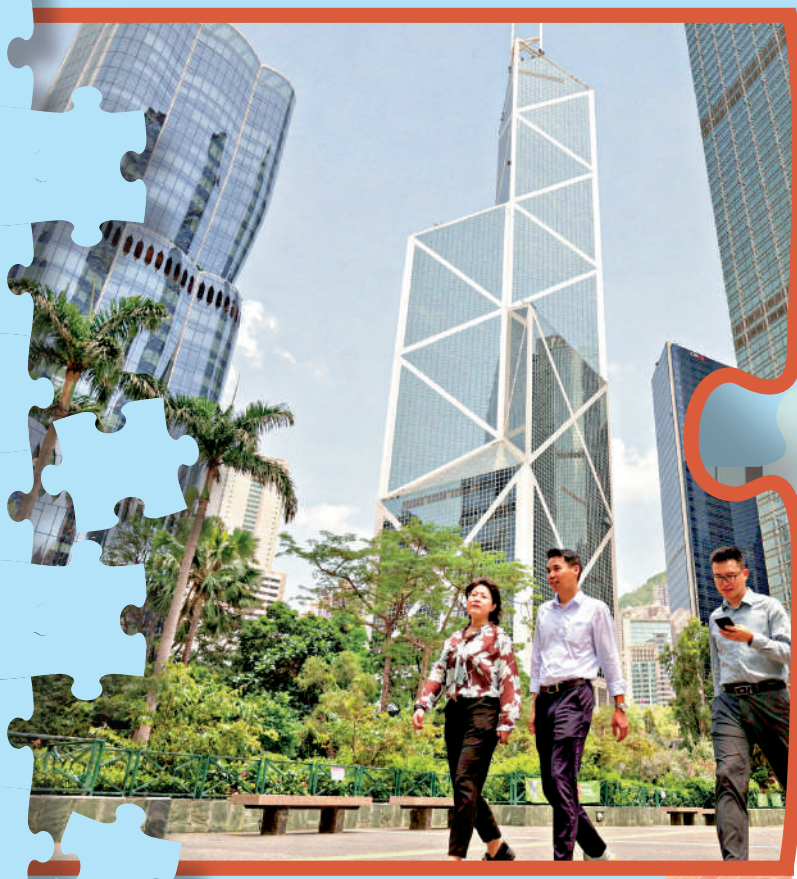
▲專家認為，香港過去過於依賴金融地產業，對新興產業投入和轉化不足。

《大公報》今日起推出「我們的藍圖」專題系列，立足創新、土地、房屋、產業等核心維度，用事實說話，廣納政府、學者及民間多元聲音，為香港編制首個「五年規劃」建言獻策，為「五年規劃」公眾諮詢凝聚共識。