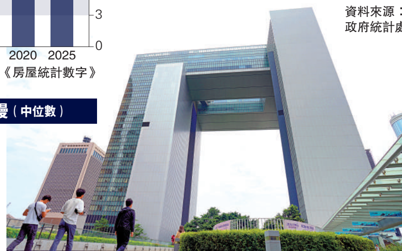
▲香港首個五年規劃公眾諮詢今日正式展開，標誌着香港治理邁向策略性、全局性規劃的新階段。

要主動對接國家「十五五」規劃，堅持和完善行政主導」。2026年1月26日，中央港澳辦主任夏寶龍在全國港澳研究會專題研討會上指出，特區政府各部門要「主動加強對特別行政區發展的頂層設計和戰略謀劃」，增強未來發展的「前瞻性、主動性」。