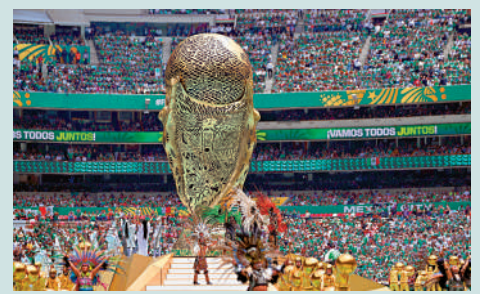
▲美加墨世界盃上周五火熱開幕。

查閱賽事經濟相關的學術研究，普遍認為大型賽事會總體拉動就業增長，但這一效應的持續性可能低於預期，且較難以持續。在過往美國舉辦的幾次奧運會(1984洛杉磯奧運會、1996亞特蘭大奧運會、2002鹽湖城冬奧會)與世界盃賽事(1994美國世界盃)期間，舉辦地的確迎來了休閒餐飲的繁榮，但在全國範圍來看其實效果有限。