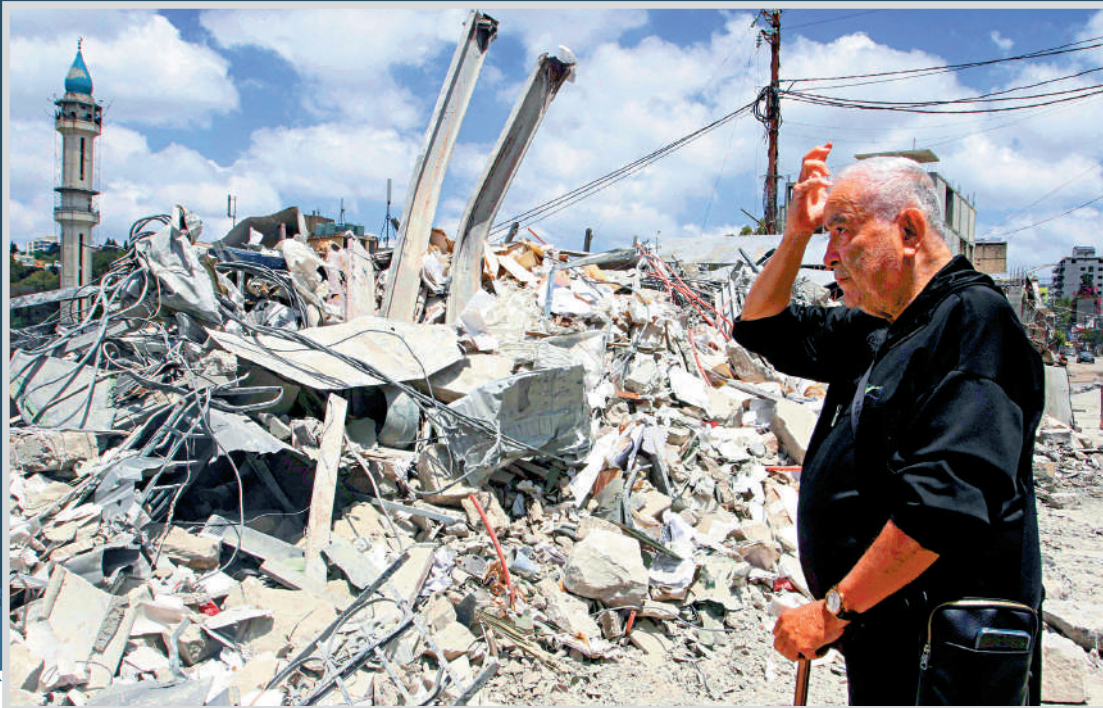
▲美伊同意在包括黎巴嫩在內的各條戰線停火，但黎巴嫩仍面臨以色列的襲擊。