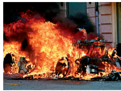
▲反對G7峰會的示威者14日在日內瓦點燃一輛特斯拉電動車。