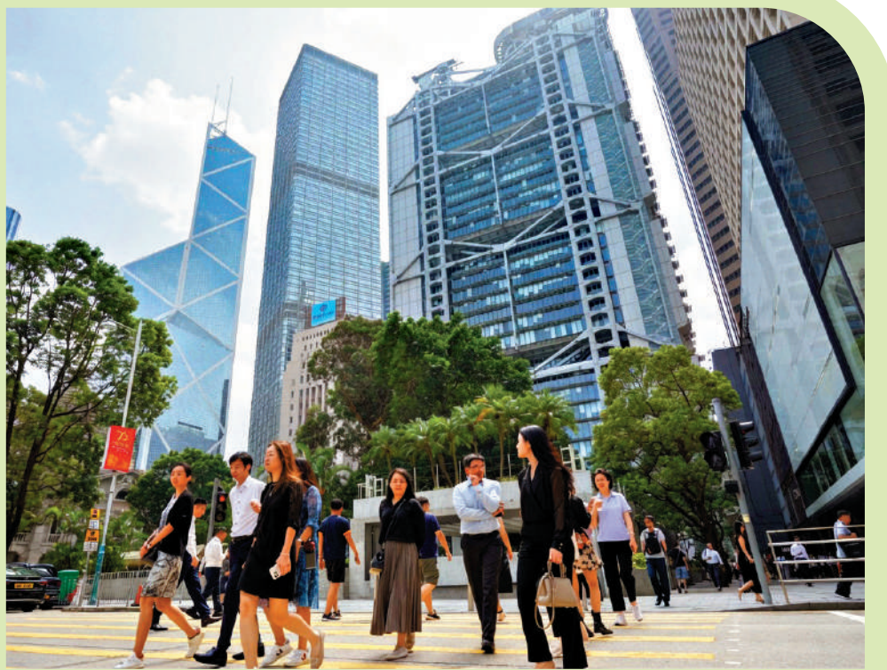
▲諮詢文件提出，鞏固提升香港國際金融中心地位，強化全球離岸人民幣業務樞紐。

諮詢文件提出，特區政府將按照國家「十五五」規劃方向，深化股票、債券、資產管理及財富管理、保險及風險管理市場聯動發展，鞏固香港作為全球離岸人民幣中心的地位，並推展「金融+」賦能各業，包括金融科技、綠色金融及貿易融資等。文件亦提出加強與內地資本市場互聯互通，擴大跨境投融資渠道，便利國家企業「走出去」及海外資本「引進來」，並在全球經濟格局變化、地緣政治風險及數字化轉型下，提升香港金融市場深度與競爭力。