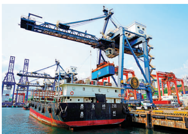
▲諮詢文件提出，將全力推進香港航運業從數字化、智能化、綠色化升級轉型。

【大公報訊】香港持續深化航運領域發展，銳意鞏固其國際航運中心地位。在首份五年規劃諮詢文件中，特區政府提出三大政策方向，推動航運業高質量升級。文件指出，香港已具備完善的海事法律、融資、保險、仲裁及船舶管理等高增值專業服務基礎，完全有條件進一步拓展高端海運服務。