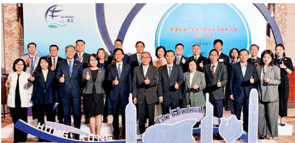
會、香港中資基金業協會、香港保險業聯會和香港中資保險業協會的主席，就是希望能夠全方位地向內地企業介紹香港全鏈條的專業服務，讓企業出海能夠找到需要的服務提供商。香港連通全球200多個國家和地區的經貿、金融網絡，對接全球頂級投資機構與產業資源，能夠幫助內地企業快速對接海外客戶、合作夥

許正宇指出，「香港匯聚全球頂尖的律師、會計師、稅務師、跨境諮詢團隊，熟悉全球主要經濟體經貿規則、稅法體系、產業貿易政策，能夠為企業提供全流程、全周期的國際化服務支撐。」是次同行的包括香港會計師公