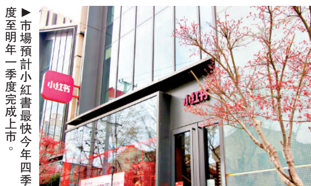
市場預計小紅書最快今年四季度至明年一季度完成上市。

【大公報訊】市場消息指出，總部位於上海的小紅書已組建專項上市團隊，聯合多家國際投行、合規顧問推進港股IPO籌備工作，預計在本月底前，以港交所允許的保密形式遞交上市申請，目前具體時間、募資規模及估值等細節仍在討論中，若推進順利，預計最快今年四季度至明年一季度完成上市。知情人士稱，小紅書本次上市，募資有望躋身近年規模最大的上市公司行列。