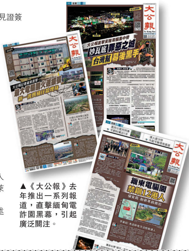
▲《大公報》去年推出一系列報道，直擊緬甸電詐園黑幕，引起廣泛關注。

《大公報》一系列報道引起廣泛關注，香港多個社交平台有大量討論，其間多名市民向《大公報》求助，包括為尋找在泰國旅遊期間失聯的親友。之後中國與東南亞國家合作，針對緬甸「KK園區」進行了大規模掃蕩行動，協助解救受害者，並逮捕多名涉案華人。一年之後，緬甸政府表示已全數拆除「KK園區」非法建築。