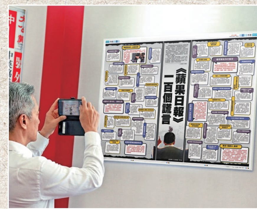
壹傳媒創辦人黎智英和《蘋果日報》惡行罄竹難書。《大公報》早於2021年6月梳理《蘋果日報》部分假新聞，列出其中100個謊言，幫助廣大讀者認清黃媒毒果的真相，珍惜來之不易的安定局面，齊心協力為香港繁榮穩定作貢獻。

一個多世紀以來，《大公報》秉承「忘己之為大，無私之謂公」的辦報宗旨，立言為公，文章報國，為新中國建設、改革開放和現代化建設，為香港回歸祖國、保持繁榮穩定發揮了積極作用。