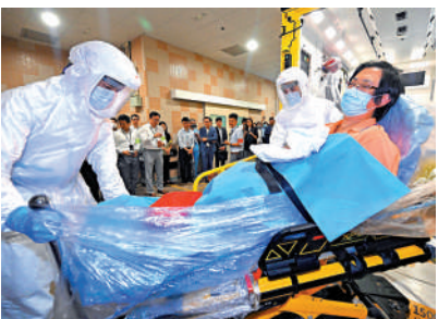
▲消防人員模擬將疑似伊波拉病患者送往指定醫院。

似感染伊波拉病患者，測試相關流程以及感染控制、深切治療、安排緊急病毒化驗等程序。