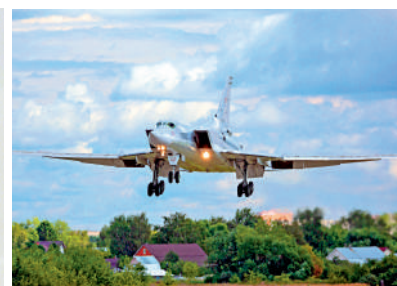
▲▲俄軍一架圖-22M3戰略轟炸機（右圖）15日在伊爾庫茨克州墜毀。