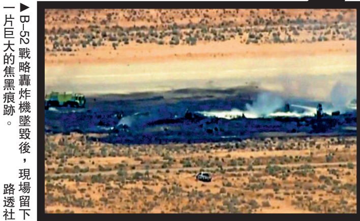
一片巨大的焦黑痕跡。