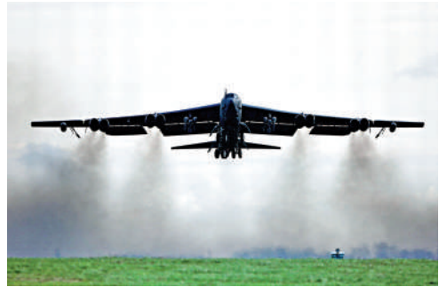
▲▼一架載有8人的B-52戰略轟炸機（下圖）15日在加州南部的莫哈韋沙漠地區墜毀，現場升起滾滾濃煙。