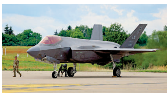
▲一架美國空軍F-35戰機飛抵德國柏林。路透社

【大公報訊】綜合路透社、美聯社報導：美國國會審計署（GAO）一份最新報告顯示，美軍F-35戰機機隊「全任務執行率」（FMC rate，完全具備執行所有任務的能力），從2021財年的38%跌至2025財年的25%，創歷史新低。