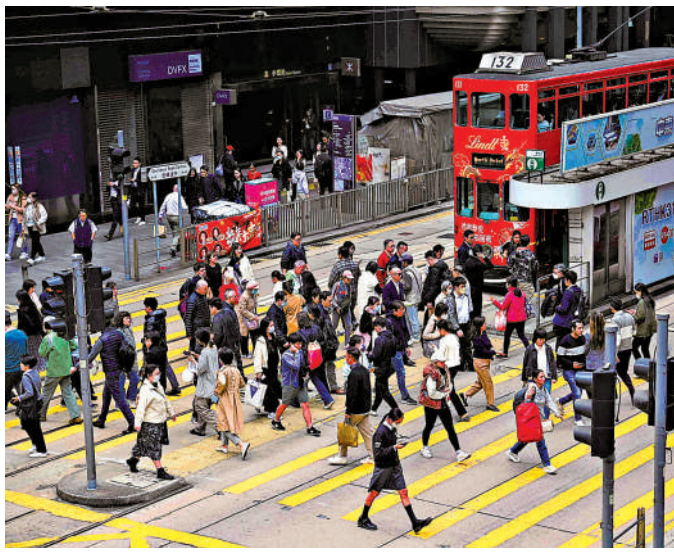
▲香港居民首季總收入較去年同期上升。

按國家／地區分析，季內中國內地繼續是香港初次收入總流入的最主要來源地，佔當季總流入38.8%；其次是英屬維爾京群島，佔16.0%。初次收入總流出方面，中國內地及英屬維爾京群島繼續是最主要目的地，分別佔當季總流出30.1%及20.6%。