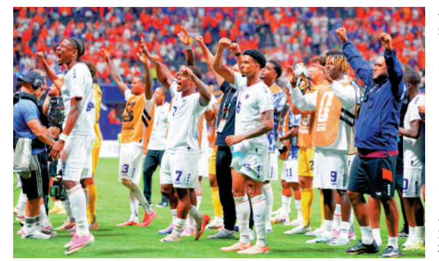
佛得角球員在世盃決賽周首秀發揮出色。