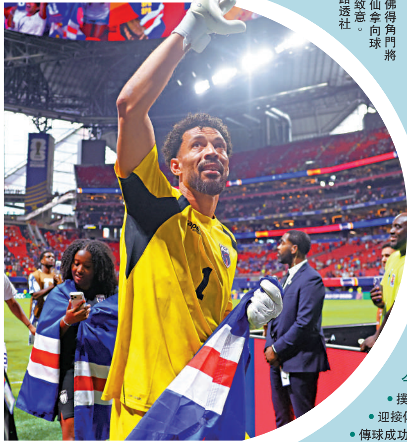
佛得角門將禾仙拿向球迷致敬。