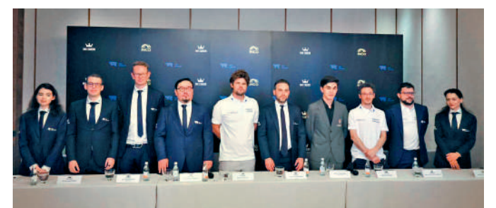
▲「世一」、挪威棋手卡爾森(左五)昨出席賽前記者會。