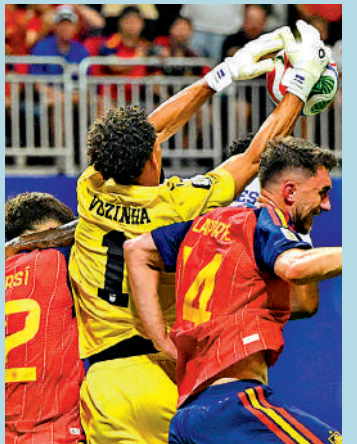
禾仙拿(中)迎出時間準繩，力抗兩名西班牙球員。