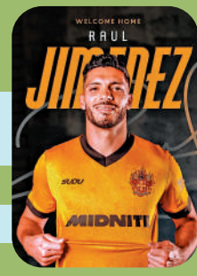
▲占美利斯新季重返狼隊。