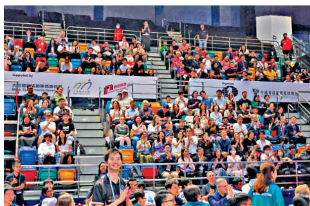
▲賽事吸引不少觀眾入場支持。