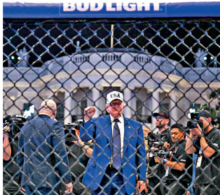
▲UFC比賽15日凌晨結束後，特朗普在八角籠內揮手致意。

「無需納稅人出資」，「這都是我的錢和捐助者的錢」。特朗普政府和克拉克建築公司從去年6月開始密切合作。承包商發票紀錄顯示，早在今年3月特朗普公開承諾不會花納稅人一分錢之前，特朗普政府已批准向克拉克建築公司支付了十幾筆公共資金，包括特勤局、白宮軍事辦公室撥款用於拆除、場地整治等工程，總額達數千萬美元。民主黨人批評，在民眾面臨通脹高企與油價飆升等危機之際，特朗普揮霍公帑建造宴會廳，與共和黨內部也擔憂，這起預算醜聞恐將衝擊即將到來的11月中期選舉選情。