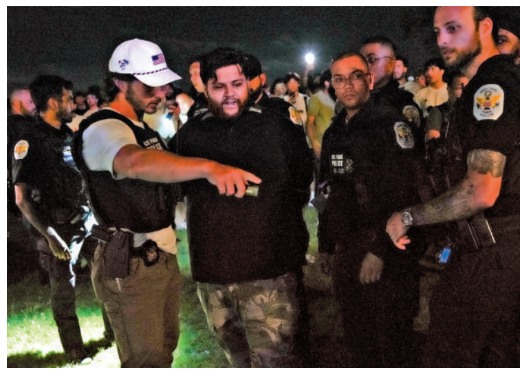
▲大批觀眾14日晚聚集在白宮附近觀看 UFC 比賽，執法人員到場維持秩序，並逮捕一名男子。

美國聯邦調查局 (FBI) 16日宣布，挫敗了一起針對14日在白宮南草坪舉行的終極格鬥冠軍賽 (UFC) 的襲擊陰謀，目前已有5人被捕。調查人員已鎖定一個涉及23人的「暗殺小組」，稱他們涉嫌計劃使用裝有爆炸物的無人機襲擊白宮附近的建築物。據悉，他們的襲擊目標包括美國總統特朗普、副總統萬斯、以色列總理內塔尼亞胡以及全球首富馬斯克等名人。