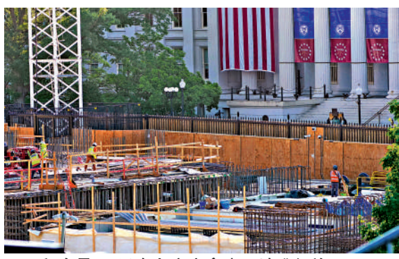
▲工程人員11日在白宮宴會廳工地進行施工。

【大公報訊】據《華盛頓郵報》報導：美媒16日披露最新承包商內部文件顯示，白宮宴會廳改造項目耗資或高達6億美元（約47億港元），遠超白宮此前對外公布的數字，而且其中超過一半將由美國納稅人埋單。宴會廳承建商克拉克建築公司的詳細成本估算報告指出，項目的總成本估算為6億美元，遠超白宮此前對外公佈的數字。文件還顯示，其中只有2.93億美元來自「私人渠道」，超過半數資金將由聯邦政府撥款，即由美國納稅人埋單。