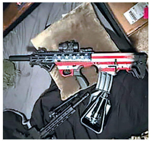
▲普羅珀購買的一把繪有美國國旗的步槍。網絡圖片