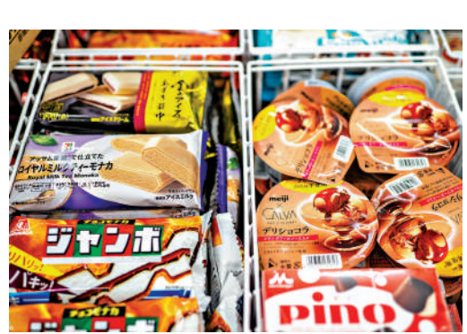
▲東京一家便利店內銷售的明治等品牌雪糕。

【大公報訊】綜合BBC、共同社報導：日本公平交易委員會 (JFTC) 16日對明治、樂天等6家知名食品企業的總部展開突擊搜查，指這些企業集體操縱雪糕價格，涉嫌壟斷。這是日本監管機構首次針對雪糕行業發起大規模反壟斷調查。