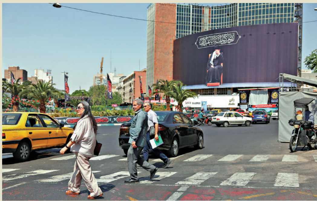
▲根據多家媒體披露的美伊諒解備忘錄文本，伊朗或將獲得一筆「重建資金」。

美伊將於19日在瑞士中部比爾根山的一家豪華度假村正式簽署停戰諒解備忘錄。瑞士政府表示將於18日至20日在簽字地點上空設禁飛區，並部署約2000名士兵負責安保工作。美媒17日援引消息人士稱，美國、伊朗和調解方正在討論將原定19日的簽字儀式提前至17日，並且以電子方式簽署。但美方此前已表示，美伊雙方已於14日以電子方式簽字。據悉，即便更改簽字時間，美國副總統萬斯率領的美方代表團與伊朗議長卡利巴夫率領的伊方代表團仍將於19日在瑞士會晤。美國彭博社、美國有線電視新聞網（CNN）和沙特阿拉比亞電視台等媒體17日披露了美國和伊朗達成的諒解備忘錄的14點內容。美伊官方尚未就這一文本的真實性公開發聲。一名伊朗消息人士說，彭博社等媒體公布的文本「並不準確」，對具體細節的描述不完整。而美方匿名官員對美國媒體說，這份文本是「政治文件」，並不反映伊朗向美國作出的「關鍵私下承諾」，尤其是關於伊朗核計劃的承諾。