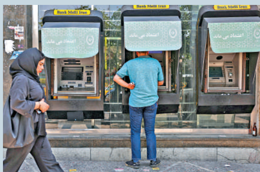
▲一名伊朗男子17日在德黑蘭使用自動櫃員機。