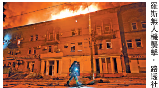
▲扎波羅熱地區。16日遭俄無人機襲擊。

局稱，未造成人員傷亡或財產損失，英方將此事視為一宗「孤立事件」，與英方日前針對一艘俄油輪的行動無關。14日，英國海軍攔截了一艘試圖通過英吉利海峽的俄羅斯「影子艦隊」油輪。