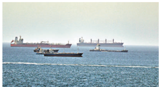
▲16日停泊在霍爾木茲海峽附近的油輪和貨船。

共和黨籍聯邦參議員格雷厄姆稱，向伊朗提供3000億美元重建資金「不明智」。霍士新聞撰稿人蒂森稱，該計劃的前景是「一場災難」。保守派評論員休伊特更警告說，特朗普的政治基本盤可能出現動搖。