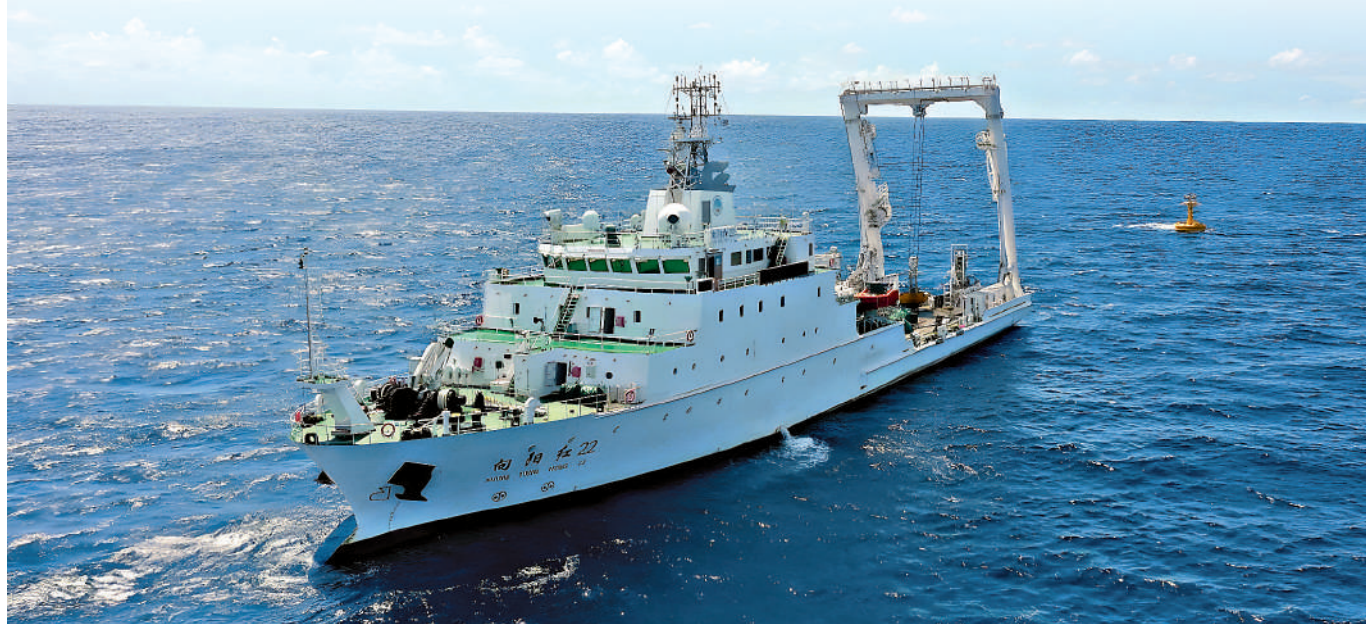
6月16日至18日，自然資源部東海局「向陽紅22」船，在中國台灣島以東海域開展了海洋環境調查。圖為「向陽紅22」船。

此次調查採用多學科同步調查手段，採集了海水環境DNA、鳥類、鯨豚類、海洋化學和天文氣象等數據，為中國進一步掌握該海域關鍵生境狀況，開展生態系統健康狀況評價奠定了基礎，也為在該海域開展海洋生物多樣性保護提供了科學依據。