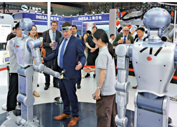
6月11日，參觀者在中國（上海）國際技術進出口交易會現場體驗通過佩戴式腦機接口裝置控制機器人。

一是提升人工智能+商品消費。增加人工智能產品新供給，擴大人工智能手機和電腦、智能家居、智能網聯汽車、智能穿戴、人工智能機器人等新一代智能產品消費。建設人工智能商品首發平台，支持人工智能商品首發首展，組織「人工智能進萬家」活動。二是擴大人工智能+服務消費。推動人工智能與居家、養老、文化