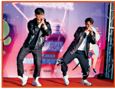
▲台北舉行「科目三」舞步比賽。

網絡歌曲大爆款《求佛》曾在台灣翻紅，眾多網友各顯神通、用《求佛》當背景音樂跳舞；抖音视频中的廣西「科目三」舞步曾紅遍台灣，在島內掀起模仿風潮。