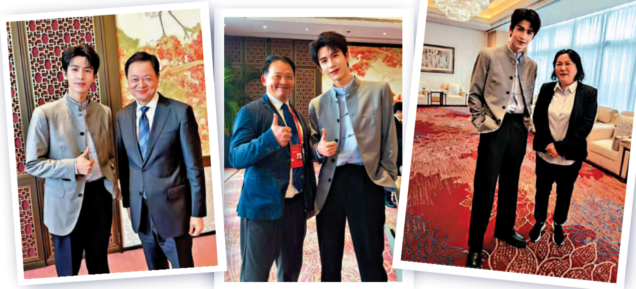
▲最近在廈門出席第十八屆海峽論壇的台灣嘉賓爭相與大陸演員張凌赫合影。

因主演多部大陸電視劇而在兩岸走紅的大陸演員張凌赫，最近在廈門出席第十八屆海峽論壇開幕式以地道閩南語向與會台灣同胞致意，並發表「海峽的距離，擋不住同胞走近的交流步伐」的感言，真摯懇切的發言引發全場熱烈共鳴。相關現場畫面迅速在兩岸社交平台廣泛傳播，掀起跨越海峽的文化交流熱潮。