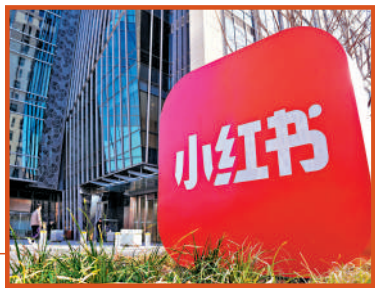
▲小紅書在台灣地區擁有大批年輕用戶。

從「嚇死寶寶了」到「像極了愛情」，從「芭比Q了」（完蛋了）到「YYDS」（永遠的神），從「恐龍扛扛」到「我姓石」，已成為台灣青年愛用的順口溜。