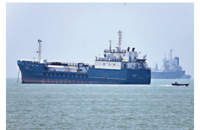
▲美伊諒解備忘錄內容包括恢復霍爾木茲海峽航運。

美伊原定19日在瑞士舉行正式簽署儀式，但在最後關頭又提前以遠程方式簽字。美方消息人士稱，這是為了讓諒解備忘錄中恢復霍爾木茲海峽航運等條款盡早生效。