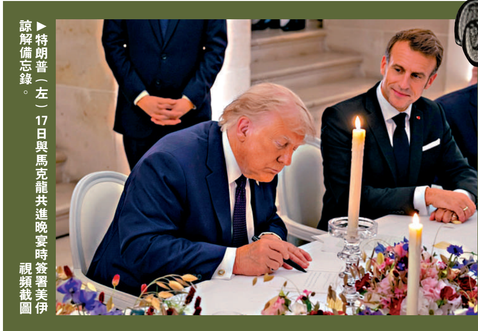
▶ 特朗普（左）17日與馬克龍共進晚宴時簽署美伊諒解備忘錄。 視頻截圖