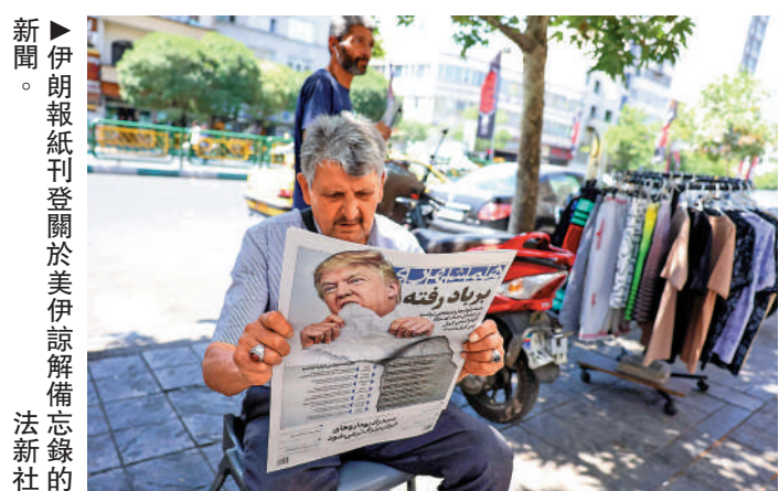
新聞。▶ 伊朗報紙刊登關於美伊諒解備忘錄的報導。