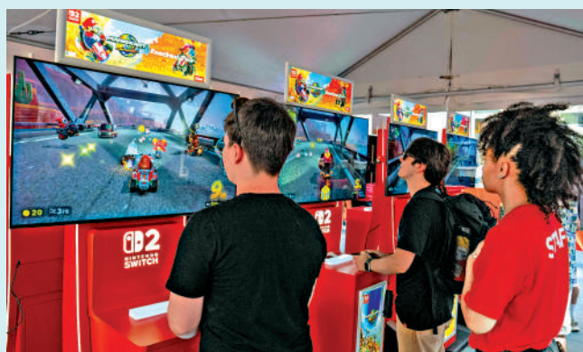
▲受芯片價格上漲影響，任天堂宣布在全球範圍內上調其遊戲主機價格。