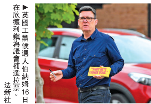
在欣德利鎮為議會補選拉票。

魁的地位，需要獲得至少20%的工黨現任議員的支持，即81人。目前據說已有上百名工黨議員背後支持伯納姆。工黨可能在9月底的工黨年度大會前後啟動黨魁選舉程序。