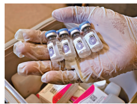
▲研究指接種HPV疫苗可降低宮頸癌死亡率。

英國政府已承諾在2040年前，徹底消滅子宮頸癌這一公共衛生威脅。但英國健康安全局數據顯示，2024年至2025年英格蘭地區僅76%的女童在15歲前完成HPV疫苗接種，低於世界衛生組織提出的2030年全球子宮頸癌防控目標：各國應確保90%的女童在該年齡前完成接種。