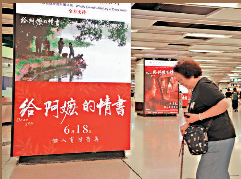
▲6月18日，電影《給阿嬤的情書》在香港上映，行人經過港鐵尖東站內的《給阿嬤的情書》宣傳廣告。