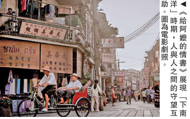
▲《給阿嬤的情書》展現「下南洋」時期，人與人之間的守望互助。圖為電影劇照。