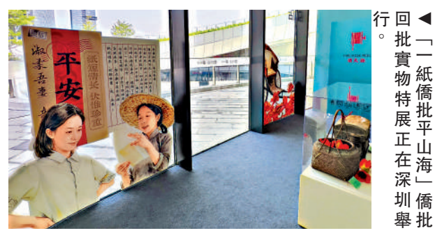
◀「一紙僑批平山海」僑批回批實物特展正在深圳舉行。