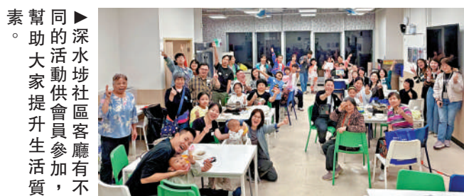
▲深水埗社區客廳會員參加活動，大家提升生活質素。