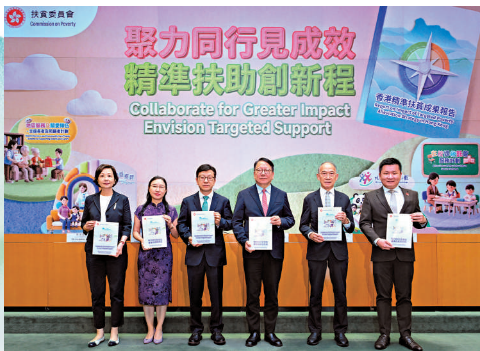
▲政務司司長陳國基（右三）18日主持記者會，公布《香港精準扶貧成果報告》。