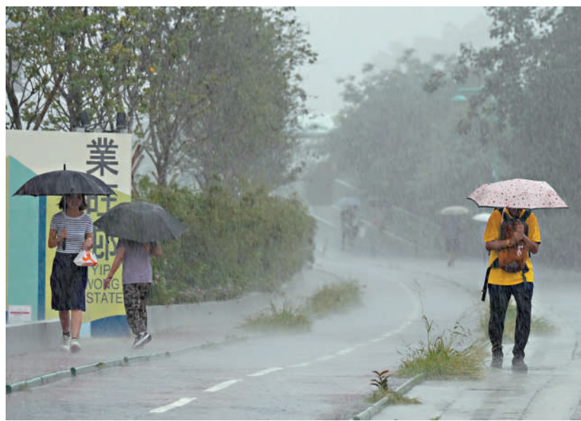
▲屯門業旺邨外街坊在暴雨中狼狽前行。▲消防處昨日共接獲57宗水浸事故，主要集中在上水及元朗一帶。