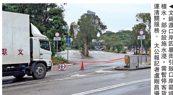
▲文錦渡口岸因暴雨引致口岸區域積水，部分設施水浸，需暫停客貨運清關服務。