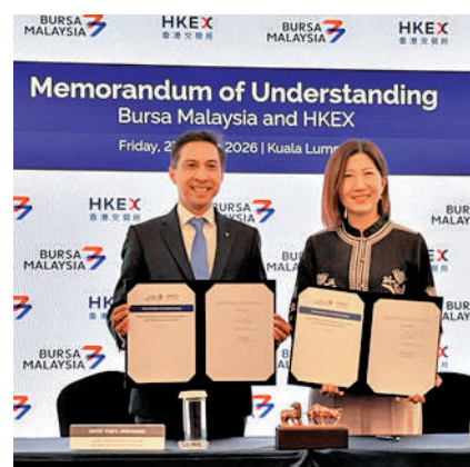
▲港交所於今年3月在吉隆坡與馬來西亞交易所簽署諒解備忘錄。

與此同時，港交所積極開拓中亞市場新版圖。今年6月，港交所分別與負責哈薩克阿斯塔納國際金融中心（AIFC）策略發展的AIFC管理局及旗下的阿斯塔納國際交易所（AIX），簽署兩份合作備忘錄，以加強協作並提升香港與中亞之間的資