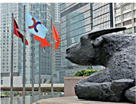
◀全球資金對於港股的優質標的興趣不減。

外資持續流入香港，除香港金融市場基本面持續改善外，全球地緣政治不確定性亦是重要一環。今年2月底，美國移以色列對伊朗發動襲擊，導致全球能源命脈霍爾木茲海峽長期阻塞，同時引發全球資金縮減中東敞口，而香港具備安全穩定的優勢，成為資金流入的目標之一。