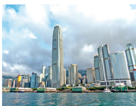
◀國家和香港金融管理部門將推出更多支持人民幣國際化的政策，提升香港國際金融中心的地位。