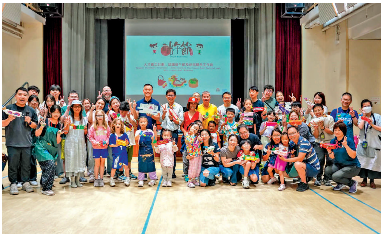
▲人才辦日前邀請來港人才攜同家人到灣仔藍屋參與義工服務，與本地居民共慶端午佳節。

為了鼓勵來港人才更好融入社區，香港人才服務辦公室（人才辦）日前與聖雅各福群會「We 嘩藍屋」合辦端午節活動，邀請來港人才攜同家人到灣仔藍屋參與義工服務，與本地居民共慶佳節。有來自海內外的人才表示，香港是安居樂業的好地方，「舉家遷港是看中這裏的安全和教育環境」。