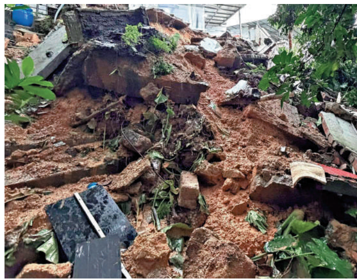
▲屯門小秀村在前日黑雨期間出現山泥傾瀉。

至於早前受山泥傾瀉影響而需要臨時封閉的大潭道，已在完成緊急修復工程後重開。民眾安全服務隊在前日黑雨期間啟動指揮中心，水災拯救隊分別前往元朗、粉嶺、上水和北區等地協助巡查，疏導及支援受影響社區。