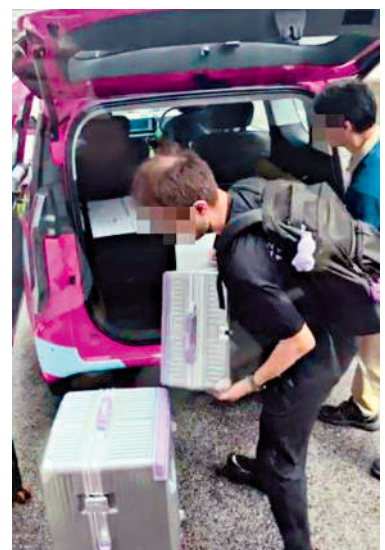
▲網上片段顯示，青山公路荃灣段疑有的士停在馬路中央落客，兩名乘客在車尾箱搬出行李箱，並橫越兩條行車線到行人路。

自己及車上乘客，又或其他道路使用者造成危險的地方停車。在路中心停車或上落客不但阻塞交通，亦威脅其他道路使用者的安全。署方亦提醒，行人應在安全地點橫過馬路。